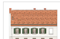
Historische Dorfschmiede (Wohnhaus)