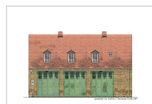
Neue Feuerwache Marienfelde 1950