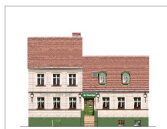
Gasthof „Zur grünen Linde“

Der alte Dorfkern hat sich bis heute erhalten können. Durch weitgehende Verkehrsberuhigung bietet er die Möglichkeit zur Erholung. Er wird durch die um 1220 erbaute Dorfkirche markiert. Diese ist das älteste erhaltene Bauwerk Berlins und eine der ältesten Feldsteinkirchen der Mittelmark. Der Dorfanger geht unmittelbar in den Gutspark über.