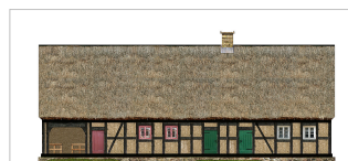
Schul- und Hirtenhaus 1787