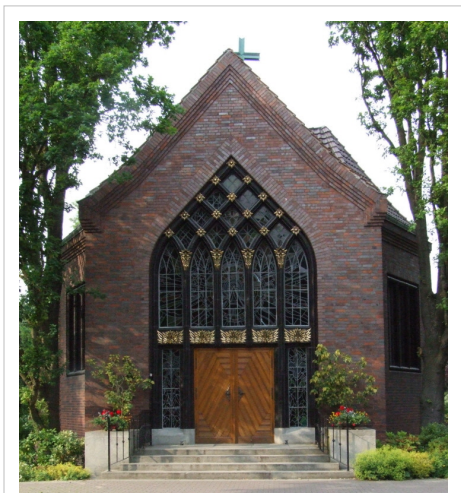
Die Eingangsseite der Kapelle auf dem Friedhof Marienfelde

Der Ausbau der Dresdener Bahn zu einer schnellen Fernbahntrasse ist geplant. Die Anschlüsse zum Nord-Süd-Tunnel am S-Bahnhof Priesterweg sind bereits gebaut.