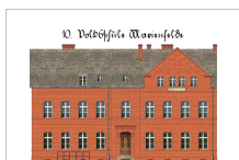
10. Volksschule Marienfelde 1905 (um 1970 abgerissen)