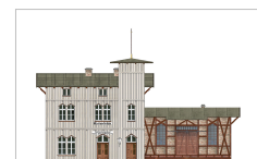
Bahnstation Marienfelde 1889

Westlich des Angers befindet sich das ehemalige Kloster vom Guten Hirten , das von 1905 bis 1968 als Erziehungsheim für Frauen und Mädchen betrieben wurde.